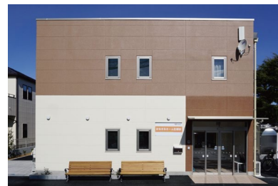
はなまるホーム北越谷

ア イセイ薬局グループの株式会社愛誠会は、新たなグループホーム（認知症対応型共同生活介護）として「はなまるホーム北越谷」を埼玉県越谷市にオープンしました。グループホームとは、認知症をお持ちの高齢者の方に、少人数で自宅にいるのと同じように暮らしていただく施設。入所者同士が持てる能力で互いに補い合うとともに、スタッフ全員が家族同様に接するなど、コミュニケーションを大切にしたい生活の場です。「はなまるホーム北越谷」のオープンにより、アイセイ薬局グループが運営する介護施設は34施設※となりました。「はなまるホーム北越谷」は、これまでの施設と同様に薬局とのシナジーを最大限に活かし、地域の高齢者福祉とご利用者さまの安心な生活を支える場として運営してまいります。