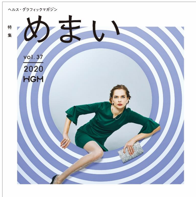
Vol. 37「めまい」号 表紙