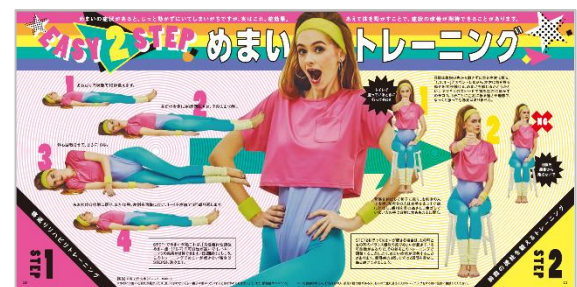
P.10-P.11 EASY 2 STEP めまいトレーニング

株式会社アイセイ薬局（本社：東京都千代田区、代表取締役社長：藤井江美）は、3月16日、自社で編集・発行する予防医療啓発情報誌「ヘルス・グラフィックマガジン Vol. 37「めまい」号」を発行しました。ヘルス・グラフィックマガジン（HGM）は毎号ひとつの症状にフォーカスし、専門医や各分野の専門家による症状や改善方法などの情報を、グラフィックスを効果的に活用することでわかりやすくお届けする季刊フリーペーパーです。本号では、症状に悩んでいる人が多い一方で、ともすれば「大したことない」「病院に行くほどではない」と思われがちな「めまい」に焦点を当て、めまいの症状と原因、めまいの改善が期待できる簡単なトレーニング、リハビリなどについて解説・紹介しています。本号でもすべての記事にオリジナルのグラフィックスを配置しており、めまいに悩む方の前向きな「一歩」を後押しする1冊になるよう、よりポップなデザインに仕上げました。